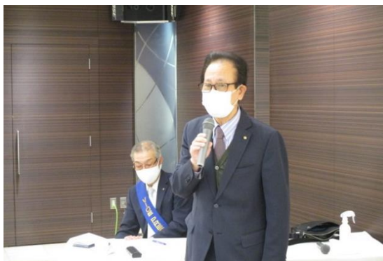
御尊父様御逝去にあたってご挨拶