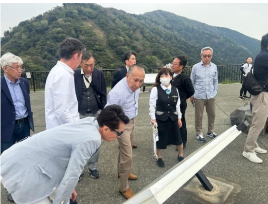
新阿蘇大橋展望所(ヨ・ミュール)