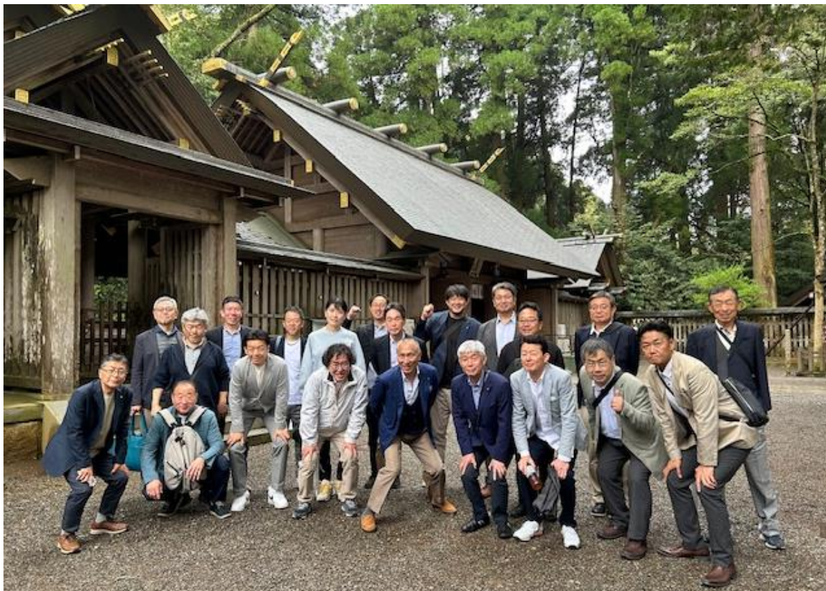
参拝・パワースポット 天岩戸神社