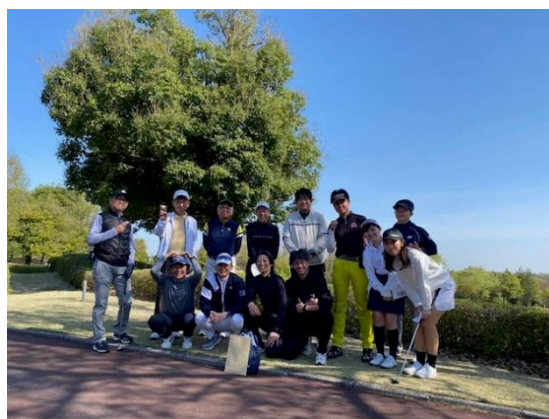
4月9日、有志による志木クラブ内で親睦ゴルフコンペが森林公園ゴルフ倶楽部にて開催されました