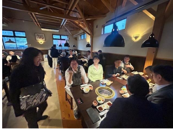
高千穂牛レストラン 和