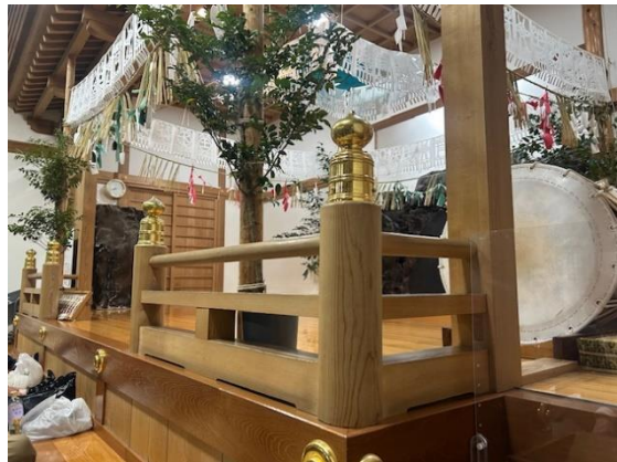
高千穂神社(夜神楽鑑賞)