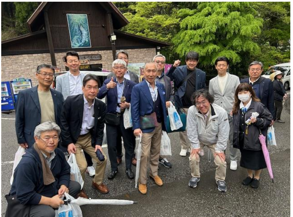
神秘の渓谷「高千穂峡」(↓集合写真も)