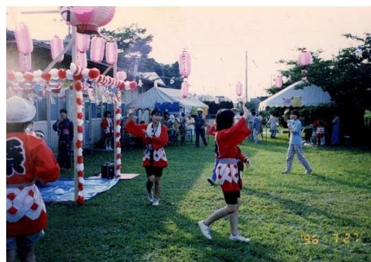
平地での盆踊り大会