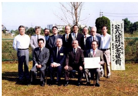
森ガバナー、朝霞市岡野市長出席の下桜の木植樹