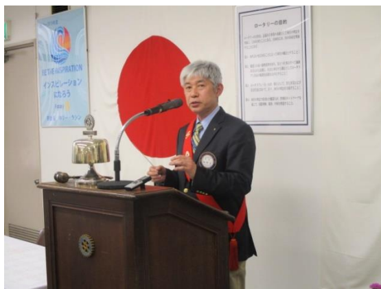
ソングリーダー・四つのテスト 塩野章会員