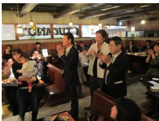
ギター演奏とサンバのアトラクションを満喫