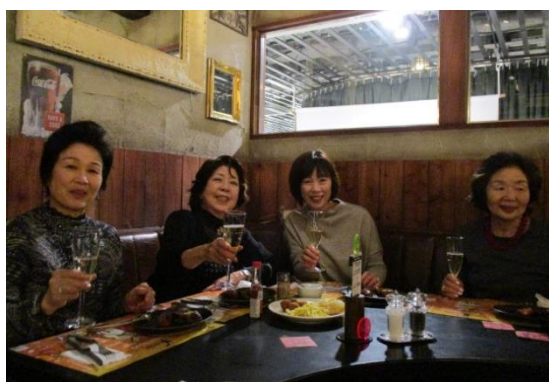
会員夫人のみなさま、今年も大変お世話になりました ありがとうございました